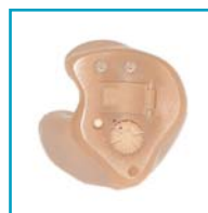
Ultimo 3 Intra

L'Ultimo 3 est un tout nouvel appareil qui est doté de puissants algorithmes de traitement du signal. Ses systèmes avancés de réduction de bruit et de gestion du larsen améliorés lui permettent de performer admirablement dans tout type de situation. Le système de masquage d'acouphène fait de l'Ultimo 3 un appareil distingué et versatile. Le système de reconnaissance et de classification de l'environnement I-Scene lui permet d'apporter des changements en temps réel aux paramètres et d'ainsi naviguer avec aisance d'une situation à une autre. De plus, la performance dynamique en temps réel est améliorée grâce aux systèmes d'élargissement de la dynamique et de réduction de distorsion, pour une reproduction plus juste et naturelle. L'interface de programmation entièrement ouverte permet au professionnel d'ajuster avec précision tout paramètre afin de mieux répondre aux besoins de ses patients. Les assistants automatisés I-Fit, SAM (Situations Automated Manager) et PASS (Patient Assisted Solutions System) sont toujours au rendez-vous afin de rendre les ajustements de base et la résolution de problèmes des tâches simples et rapides.