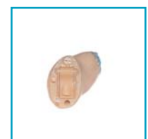
Ultimo 3 CIC