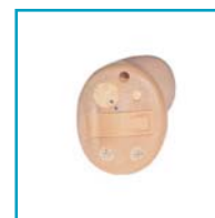
Ultimo 3 Canal